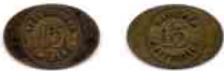
1. SPÅRVÄGARNA I WIBORG 15 / WIIPURIN RAITIOTIET 15. Messinkiä (v:lta 1912), 17 x 25 mm, n. 1,9 g.

Liikenteen alkaessa käyttöön otetun Viipurin raitioteiden ensimmäisen polettisarjan oli valmistanut ruotsalainen C. C. Sporrang & C:o. 11 Julkaistujen taksojen mukaisesti tähän polettisarjaan kuului messinkiset aikuisten 15 (kuva 1) ja lasten 10 pennin (kuva 2) poletit, minkä lisäksi siihen sisältyi arvoituksellinen P/H -poletti (kuva 3). Viimeksi mainittua polettia