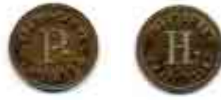
3. SPÅRVÄGARNA I WIBORG P. / WIIPURIN RAITIOTIET H. Messinkiä (v:lta 1912), 16,5 mm, n. 1,2 g.

Arkistotietojen perusteella C. C. Sporrong & C:o toimitti vuosien 1912 ja 1917 välillä Viipurin raitioteiden messinkipoletteja vähintään seuraavasti: 15 pennin poletteja yhteensä 40 000 kpl, 10 pennin poletteja yhteensä 2 000 kpl ja P/H -poletteja yhteensä 9 000 kpl. 13 P/H -poletin suhteellisen suuri toimitusmäärä (17,6 % kaikista) ei puolla käsitystä siitä, että kyse olisi henkilökunnan vapaapoleteista. 14 Tavarankuljetuksesta (vauusillalla) puolestaan perittiin ilmoituksen mukaan taksan eli käytännössä henkilömaksun suuruinen maksu, joten P/H-poletti tuskin liittyy hinnoittelussa alusta alkaen erikseen mainittuun tavarankuljetusmaksuun. 15 Mahdollinen selitys P/H -poletille löytyy vuonna 1917 julkaistuista hinnankorotustiedoista. 16 Niissä mainitaan erityinen virkamiespoletti (posti- ja kaupungin virkamiehet), joita korotuksen jälkeen saisi 12 kpl