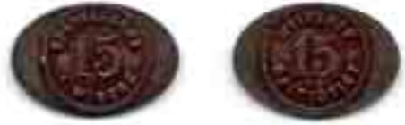
4. SPÄRVÄGARNA I WIBORG 15 / WIIPURIN RAITIOTIET 15. Rautaa (v:lta 1918), 17 x 25 mm, n. 2,5 g.

Raitiotieliikenteen normalisoiduttua oli elokuussa 1918 vuorossa uusi hinnankorotus. Kaikki alennukset poistettiin ja kertamaksuksi tuli 15.8. alkaen yhtenäisesti 25 penniä. 43 Liikkeessä olevia alennuspoletteja sai käyttää 19.8. saakka, minkä jälkeen niitä lunastettiin takaisin vielä 1.9. asti entisellä hinnalla. Lisäksi kerrottiin, että vaihtorahapulan vuoksi yhtiö tulee laskemaan liikkeeseen uusia rautapoletteja (kuva 4), joita myydään 4 kpl markalla. Vanhojen polettien poistaminen liikenteestä [ennen uusien rautapolettien käyttöönottoa] aiheutti tyytymättömyyttä erityisesti kaikkia koskettavan vaihtorahapulan vuoksi. 44 Mainittakoon tässä yhteydessä, että 25 pennin hintaisiin uusiin rautapoletteihin oli arvoksi merkitty 15, kuten oli myös vuoden 1918 alkupuoliskolla tammi-elokuun väliseksi ajaksi uudelleen 20