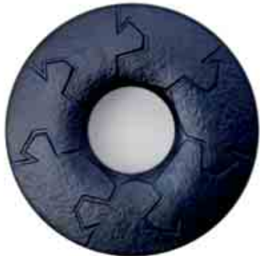
Kuva 2. Itsenäisyyden juhluvuoden mitali Yhdessä on taiteilija Hannu Veijalaisen muovailema ja se toteutetaan osana Suomi 100 -hanketta. Kuva on havainnekuva, jonka väri ja patina saattavat poiketa lopullisesta. Mitalia lyödään 100 kappaletta pronssista. Sen koko on 80 mm. Kuva: Hannu Veijalainen.