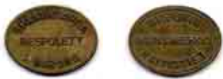
5. SPÄRVÄGARN A I WIBORG RESPOLETT / WIIPURIN RAITIOTIET MATKAMERKKI. Messinkiä (v:lta 1920), 18 x 24 mm, n. 2,2 g / 2,9 g.

”Raitioteillämme matkustavalle arv. yleisölle kohteliaimmin ilmoitamme, että sittenkun tilaamamme metalliset matkamerkit nyttemmin ovat saapuneet sekä raitioteillämme jo käyttöönkin otetut, kelpaavat syksyn kuluessa liikkeeseen lasketut paperipoletit ja alennusmerkit maksuksi ainoastaan nykyisen marraskuun ajan, ja on yleisön hallussa mahdollisesti olevat sellaiset poletit ja merkit mainitun ajan kuluessa joko käytettävät taikka konttorissamme Tehtaankatu N:o 4 klo 9–½1 & 2–4 päivällä