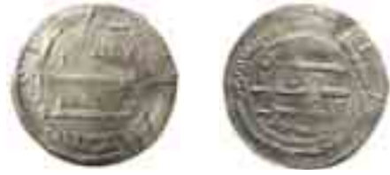
Kuva 2. Niin kutsuttu Moosesraha. ”Madinat al-Salam” 149/766–67. Spillings II. (Rispling 2004: 129).

Mooses oli profeetta ja yksi Vanhan testamentin päähenkilöistä. Raamatun mukaan hän sai Jumalalta kymmenen käskyä Siinain autiomaassa kivilaattoihin hakattuna. Mooses johdatti israelilaiset Egyptin orjuudesta luvattuun maahan sen jälkeen, kun israelilaiset olivat vaeltaneet Siinain