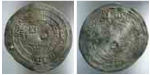
Kuva 3. Niin kutsuttu lintu- tai haukkaraha. Kiovan Venäjän ruhtinatar Olga (945–962)? Novgorod tai Pihkova? Alvan Gandarve, Gotlanti (2009).