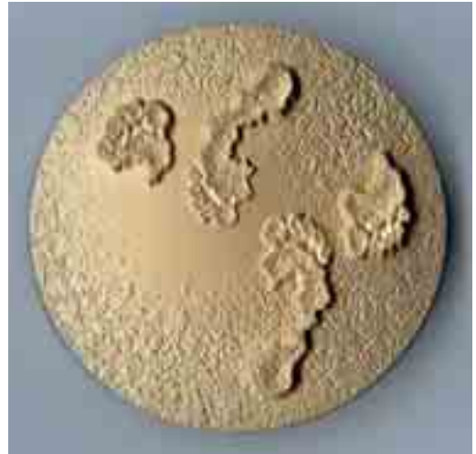
Kuva 1. Sauli Niinistö -mitali on taiteilija Tapio Kettusen muovailema ja sen ovat toteuttaneet Suomen Mitalitaiteen Kilta ja Paasikivi-Seura. Mitalia on lyöty 300 kappaletta pronssista. Sen koko on 72 mm.