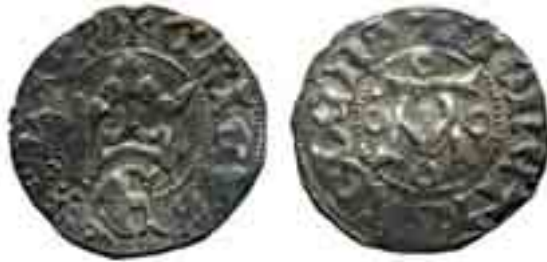
Harvinaisuus Turusta (ks. s. 80)