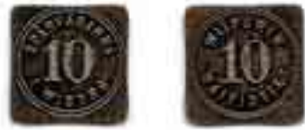
2. SPÅRVÄGARNA I WIBORG 10 / WIIPURIN RAITIOTIET 10. Messinkiä (v:lta 1912), 17 x 17 mm, n. 1,7 g.